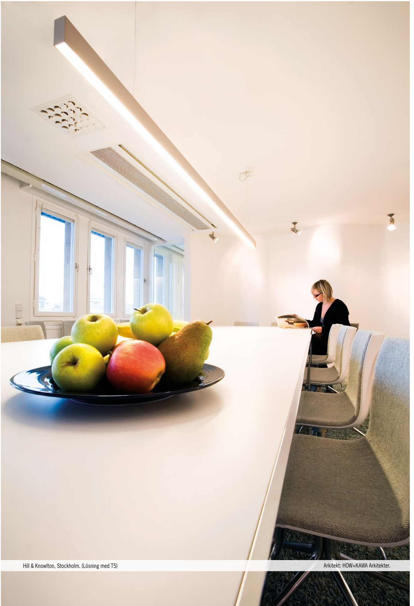
Hill & Knowlton, Stockholm. (Lösning med T5)